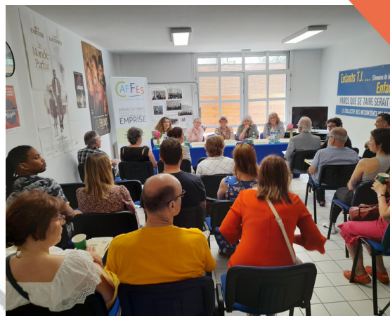
AG CAFFES 2023

Devenu national depuis 2014, le CAFFES , qui a élargi ses services, a cette année 10 ans et bénéficie d'une reconnaissance d'intérêt général. Je remercie les équipes successives qui ont œuvré pour le bien des familles.